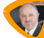
Eric A. CAPRIOLI

Expert aux Nations Unies en droit des TIC